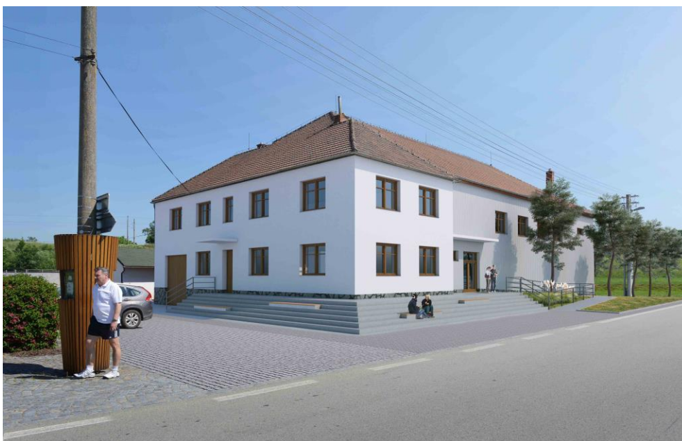
Postupně uskutečňovaná úprava budov KD a OÚ.

V loňském roce jsme pokročili v rekonstrukci budovy KD a OÚ. Dokončili jsme vnější izolaci zbytku budovy, postavili schody (včetně zábradlí) a bezbariérový přístup do obou budov. Letos chystáme minimálně novou fasádu na budově KD. Požádali jsme MMR ČR o dotaci na tuto akci.